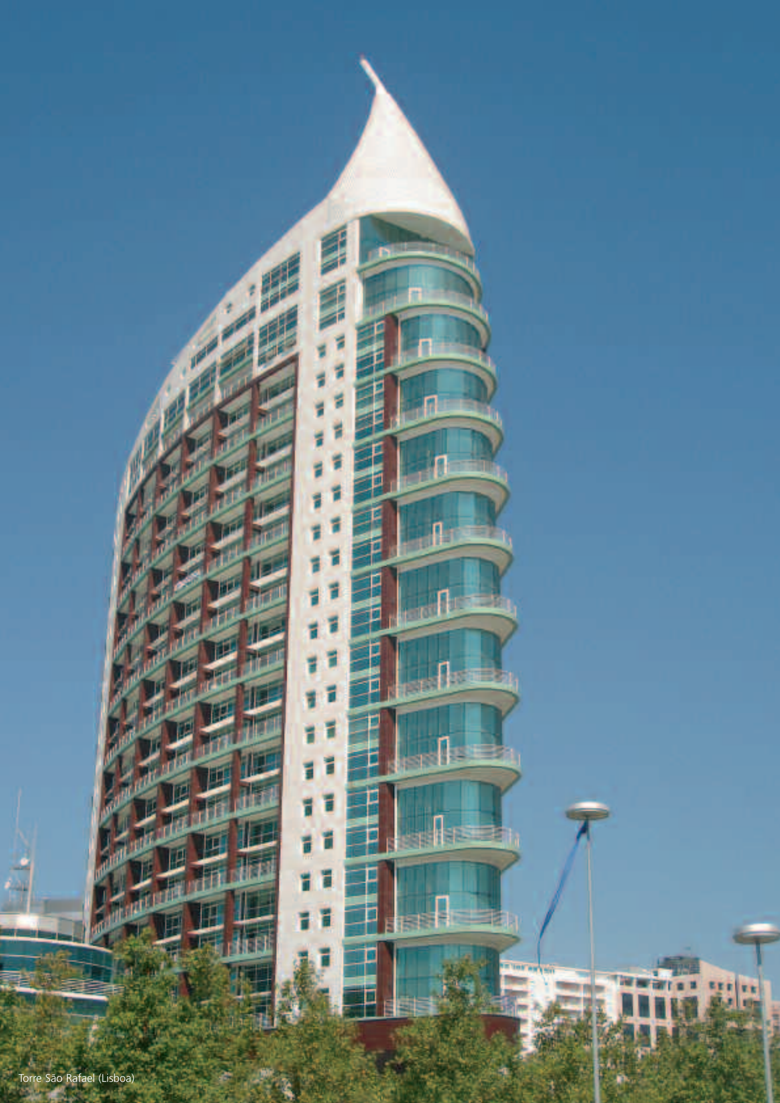
Torre São Rafael (Lisboa)